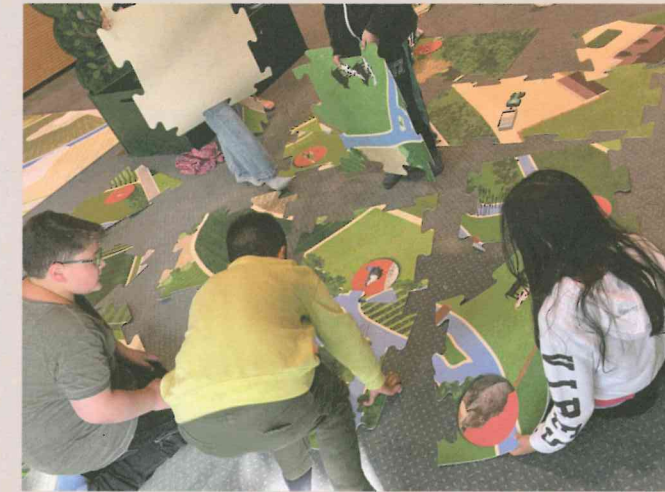
Beim Bodenpuzzle wird der Fluss in die Landschaft eingebettet